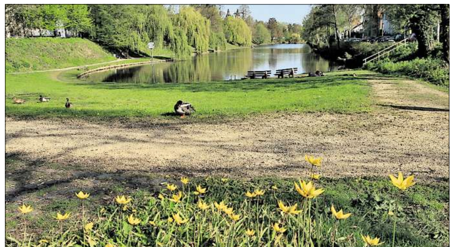
Am Kalenberger Graben können Naturliebhaber einen der seltenen Wildbestände der Weinberg-Tulpe bewundern.

Weinberg-Tulpe, die wie alle anderen Tulpen zur Familie der Liliengewächse gehört, zumeist in alten Wall- und Park-